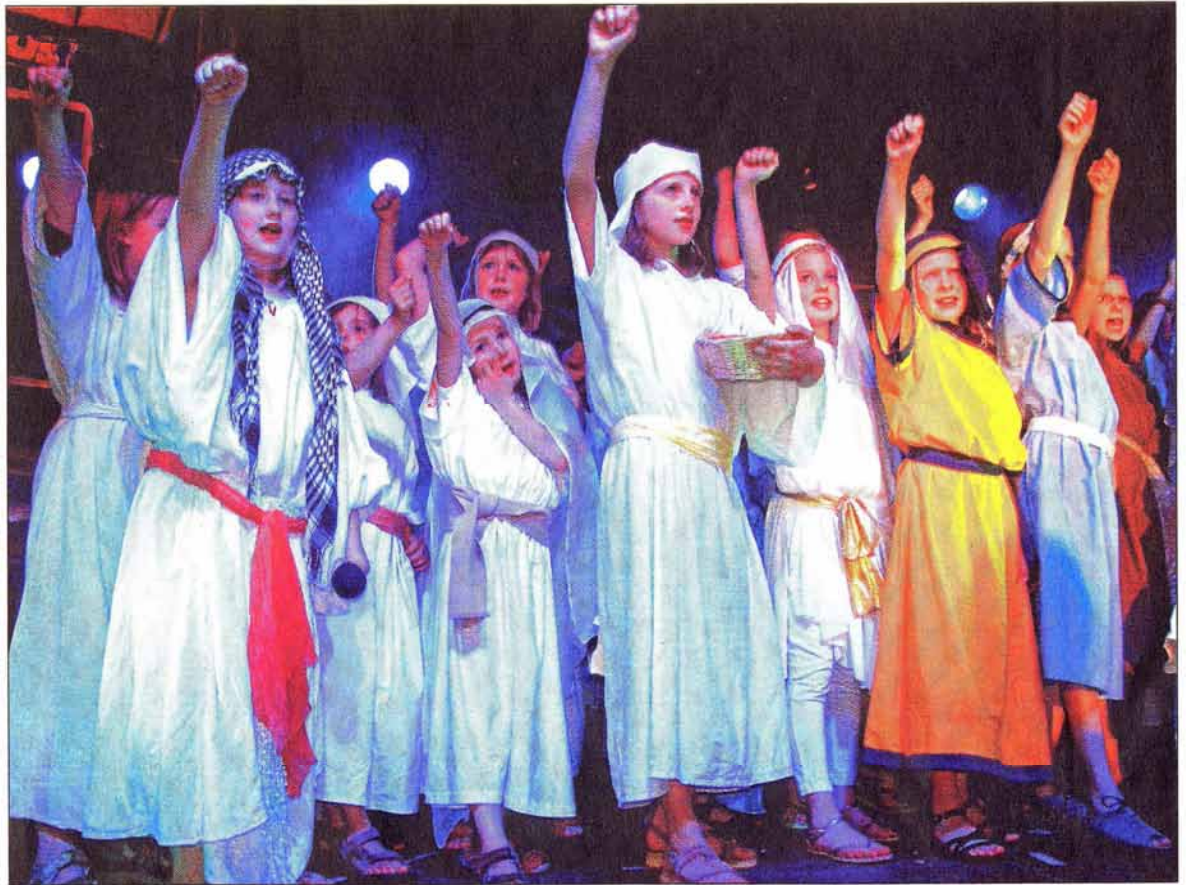
Der Kinder-Musical-Chor überzeugt bei der Freien evangelischen Gemeinde Wolzhausen mit kraftvollem Klang.

■ Inszenierung setzt auf schrille Optik und schmissige Rhythmen